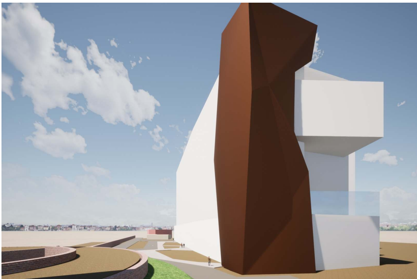
4 - Veduta da Est, dall'interno delle mura. In primo piano a sinistra, le piazze basse del bastione Cornaro del Sanmicheli.

(volumetrie schematiche ma con altezze e dimensioni reali, dedotte dal progetto presentato ai VV.F. nella Conferenza dei Servizi del 21 agosto 2020).